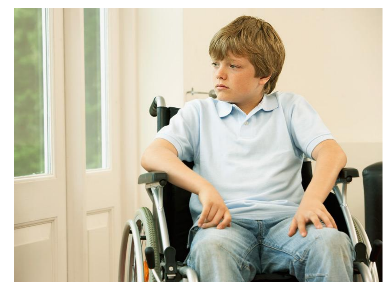
Niños de 5 a 8 años