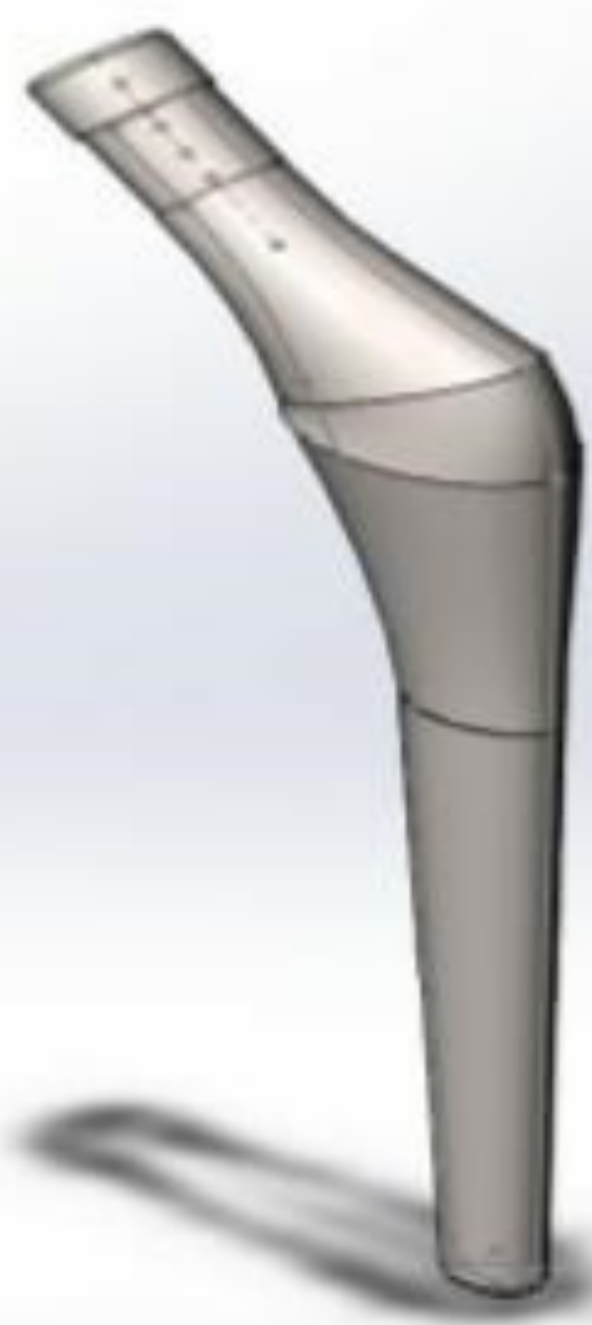
Figura 1. Modelo de Vástago en 3D.

Las medidas que se utilizaron para el vástago se tomaron del catálogo Novation [5] que posee el modelo estándar y suministra las dimensiones más relevantes. Algunas medidas no provistas fueron aproximadas con referencia a dimensiones existentes. Los datos de dimensionamiento obtenidos fueron usados para modelar el vástago en el programa de diseño SolidWorks® como se muestra en la figura 1.