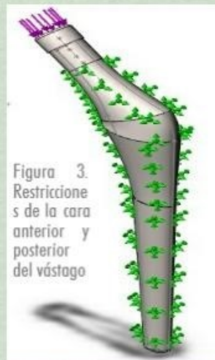
Figura 3. Restricciones de la cara anterior y posterior del vástago

Se seleccionó el modelo de simulación el cual trabaja mediante modelación por elemento finito, donde se realizó un análisis de tipo estático y la creación de malla fue uniforme para el vástago utilizados los parámetros de 5 mm como el tamaño global como es mostrado.