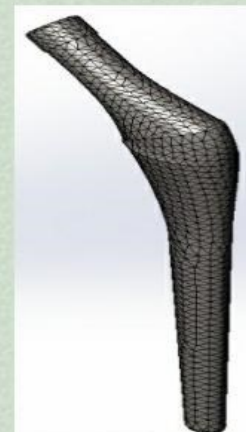
Figura 2. Modelo malla del vástago