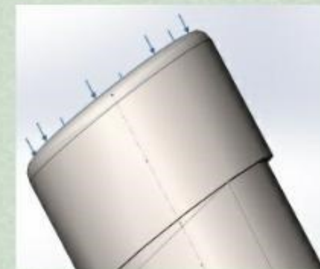
Figura 4. Aplicación de carga