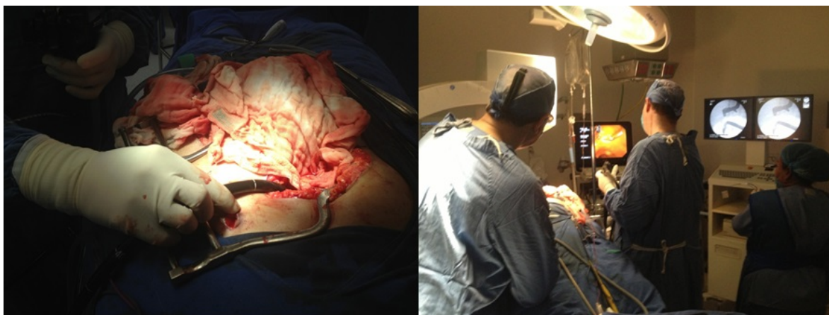
Figura 3: CPRE transoperatoria.

Colangio Pancreatografía Retrógrada Endoscópica: El protocolo de manejo de la litiasis del colédoco está siendo muy controvertido, la CPRE como procedimiento terapéutico tiene un beneficio bien demostrado, se puede realizar desde el preoperatorio, durante el transoperatorio o en el postoperatorio; cuando el diagnóstico es muy probable, lo recomendado es realizarlo en el preoperatorio, sin embargo se han visto beneficios, sobretodo en el plano económico al realizar el procedimiento en el transoperatorio, dejando el postoperatorio para los casos en los que la coledocolitiasis se deba a un cálculo residual. Existe una indicación muy clara del uso de la CPRE en el transoperatorio y es el caso de los pacientes sometidos a algunos tipos de cirugía bariátrica en los que se corta el estómago y el segmento distal ya no puede ser abordado por endoscopia y, por lo tanto, tampoco el duodeno, lo que impide que se puede realizar la CPRE, para ello y debido a que se tiene que realizar colecistectomía en esos pacientes, durante la cirugía se abre la porción distal del estómago y se introduce el endoscopio para realizar la esfinterotomía y la extracción del cálculo, con el posterior cierre de la apertura del estómago y la extirpación de la vesícula biliar (Figura 3).