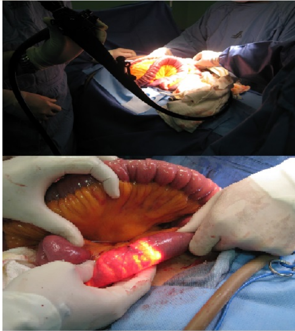
Figura 1: Endoscopia transoperatoria del intestino delgado.

fibras, sin embargo no hay un consenso acerca de la longitud de la miotomía, lo que además, constituye la más frecuente causa de falla del tratamiento al realizar una miotomía incompleta, hemos realizado la EGITO en 32 pacientes con acalasia y en 8 (25%9 de ellos se requirió de ampliar la miotomía (Figura 2).