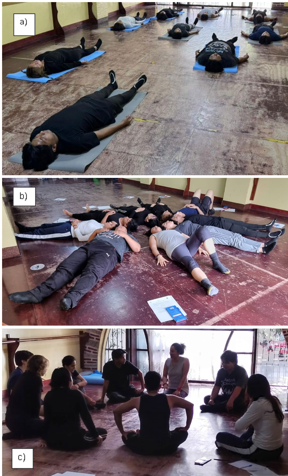
Figura 2. a) Conciencia o atención plena, b) actitud serendípica flexible y c) estado holístico propicio para acontecer en acto